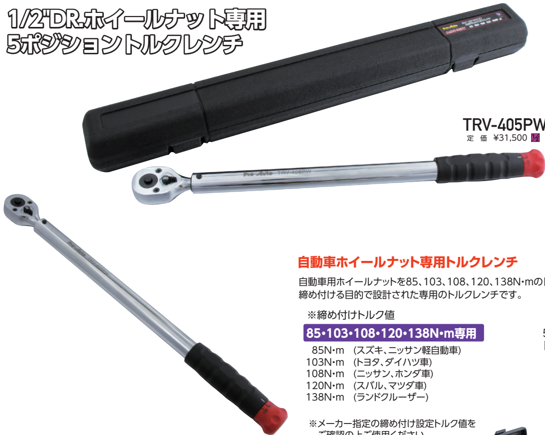
TRV-405PW 定 価 ¥31,500