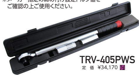
TRV-405PWS 定 価 ¥34,170